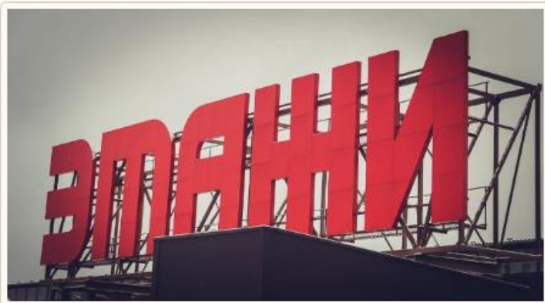
Текст: Ольга Вересова

Про «первый» и «премиум» — это не преувеличение. Можно также добавить, что уникальный и самый масштабный, и это тоже без шуток. Бизнес-центр «Этажи», сумма финансовых вложений в который на данный момент составляет более 400 млн рублей, вообще, по сути, проект будущего. Не только потому, что в конце 2017 года он был назван в числе пяти ключевых перспективных инвестиционных объектов Твери (хотя и это уже немало). Важен еще тот факт, что здание нового бизнес-центра, имеющее богатую историю и представляющее культурную и архитектурную ценность для города, прошло полную реконструкцию и все, что можно, в нем было сохранено, спасено и даже воссоздано, причем на частные средства. А это едва ли не единственный подобный случай за новейшую историю региона.