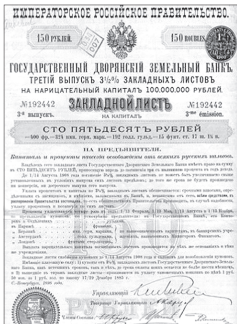
Закладной лист. Государственный земельный банк.

Финансовые ресурсы, направленные в отрасль, позволили увеличить