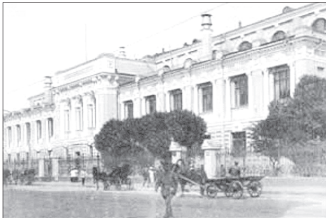
Государственный банк Российской империи.

— Юбилейная дата — 130 лет агрокредитованию — хороший повод обратиться к своим истокам, чтобы сформировать в обществе и бизнесе преемственность, заимствуя лучший опыт предыдущих поколений и обогащая его достижениями сегодняшнего дня, — говорит директор Тверского