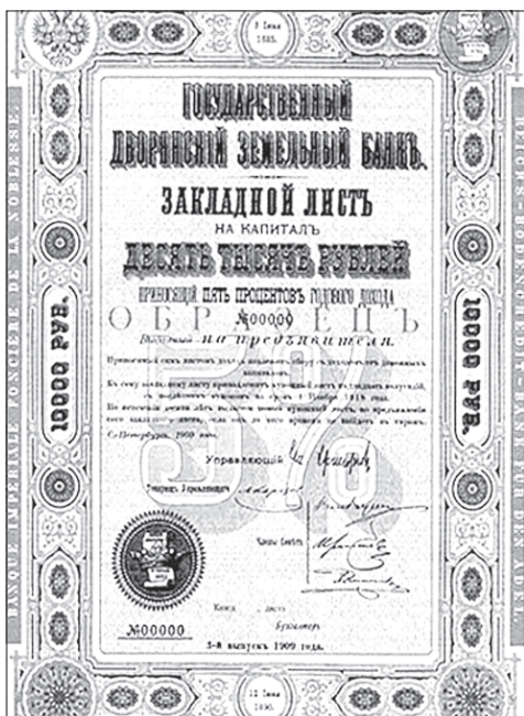
Закладной лист. Государственный Дворянский земельный банк.

Кредитный билет времен Екатерины. Начиная с 1898 г. способ печатания кредитных билетов в России производился по методу мастера Орлова и много лет был секретом. Это простой способ, при котором цветные линии фона переходили из одного тона в другой, не сливаясь в цвете, не расходясь и не прерываясь. Интересно, что предложение Орловым своего изобретения — экспедиции заготовки государственных бумаг было отклонено, в связи с чем Орлов продал свое открытие Англии. И только тогда русское правительство заинтересовалось этим способом и купило патент Орлова в Англии, конечно, переплатив за него во много раз. В Англии печатание по способу Орлова было известно под названием «Orlow-Druck», но его секрет был раскрыт только лет через двадцать.