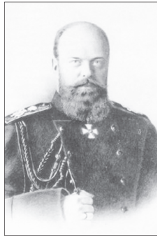
Император Александр III.

В конце XIX века, когда в стране активно происходило формирование частной собственности, государство стремилось оказать максимальную поддержку селу и форсировать развитие сельского хозяйства. Учрежденный государством Крестьянский поземельный банк стал первым российским банком, который специализировался на кредитовании крестьян. Ссуды на приобретение земли, выдаваемые мелким хозяйствам, содействовали расширению крестьянского землевладения и укреплению аграрной отрасли. В результате в начале XX века Россия стала главным мировым экспортером зерновых, увеличив почти на 40% объемы производства пшеницы, более чем на 60% — ячменя и на 45% — кукурузы.