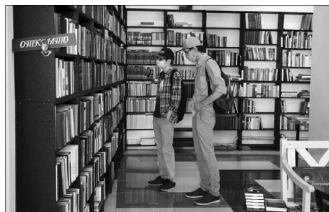
Фото и текст Елена УСПЕНСКАЯ

найти и забрать с собой бесплатные экземпляры. Есть в магазине стена с изданиями, которые распродаются по чисто символической цене — за 10 рублей. Книги доступны здесь для всех.