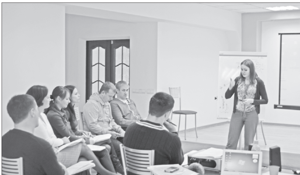
Обучающий тренинг в отделе продаж.