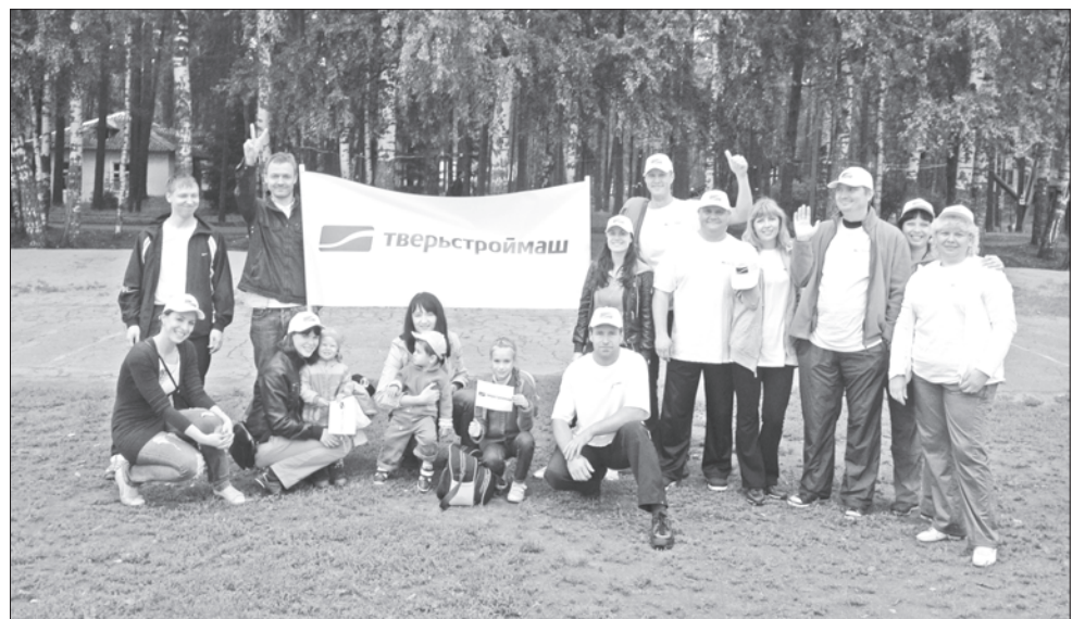
Тверьстроймаш на летней спартакиаде.