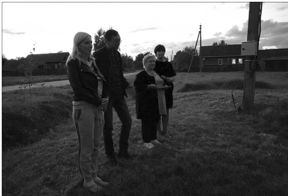
В деревнях Завидово и Воронино 24 августа были включены по 15 светодиодных уличных светильников. Программа поддержки местных инициатив-2019 в Оленинском районе успешно завершена. Всего в июле-августе этого года открыто 11 объектов ППМИ, а с начала программы (2013) - 56 объектов, что является одним из лучших показателей в Тверской области.