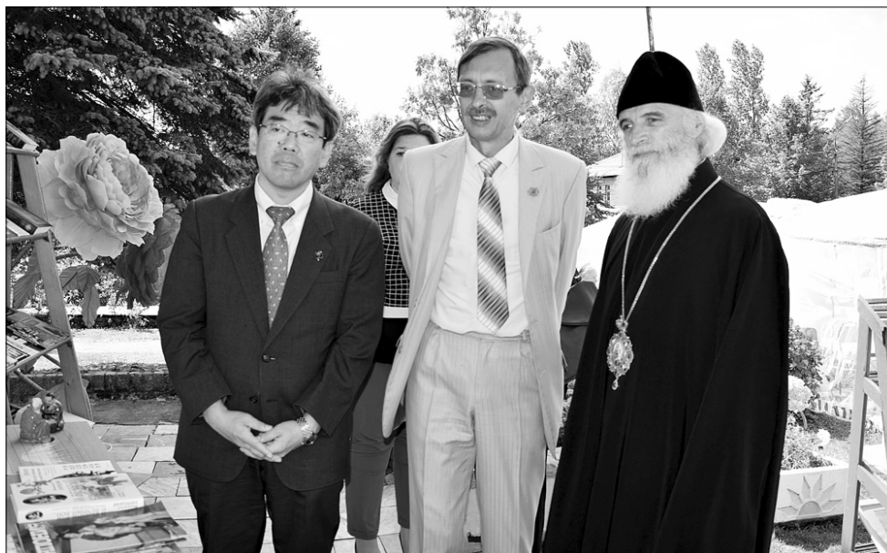
День поселка Мирный, 10 августа 2019. Мостовская земля занимает особое место на карте Оленинского района. Это второй населенный пункт района и самое большое сельское поселение с богатой историей и традициями. Здесь, на родине святого равноапостольного Николая Японского, у храма, освященного в его честь, с участием владыки Адриана и представителя посольства Японии г-на Ямомото прошла презентация макета памятника небесному покровителю оленинской земли.