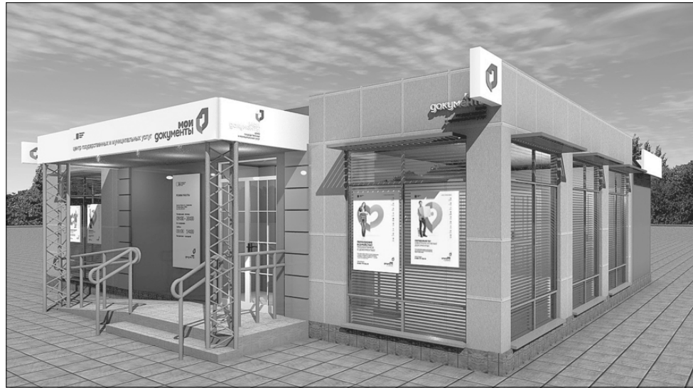
Вот таким будет новый МФЦ в Оленино всего через полгода. Эскиз взят из проектной документации.