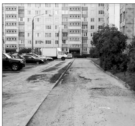
Дворовые территории Пролетарского района.