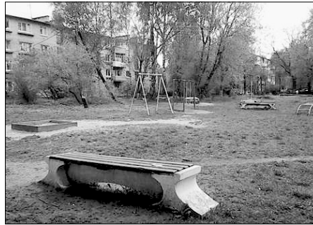
Дворовые территории Заволжского района.