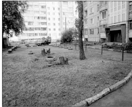
Дворовые территории Центрального района.