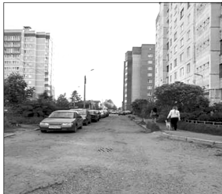
Дворовые территории Московского района.